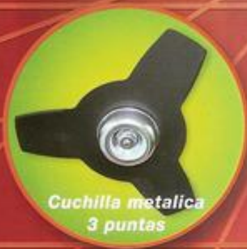
Cuchilla metálica 3 puntas